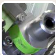
Application de points de colle sur le timbre fiscal.