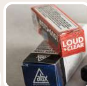
Utilisation de l'emballage.