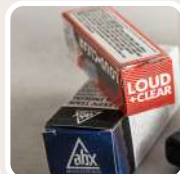
Aplicación en envases.