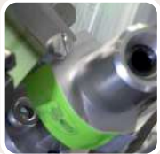
Taufbringen von Klebepunkten auf der Steuermarke