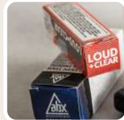
Anwendung der Verpackung