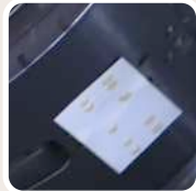
Tax adhesive application