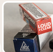
Utilisation de l'emballage.