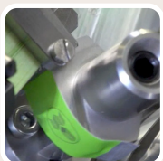
Application de points de colle sur le timbre fiscal.