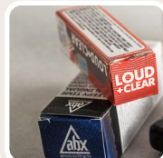
Aplicación en envases.