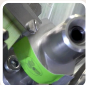
Aplicación de puntos adhesivos en timbres fiscales.