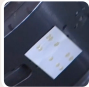
Tax adhesive application