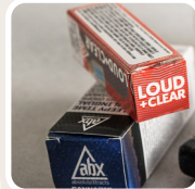
Anwendung der Verpackung