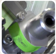
Taufbringen von Klebepunkten auf der Steuermarke